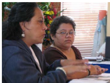
Participantes en el encuentro “Imaginando y Construyendo los Movimientos Feministas hacia el Futuro”